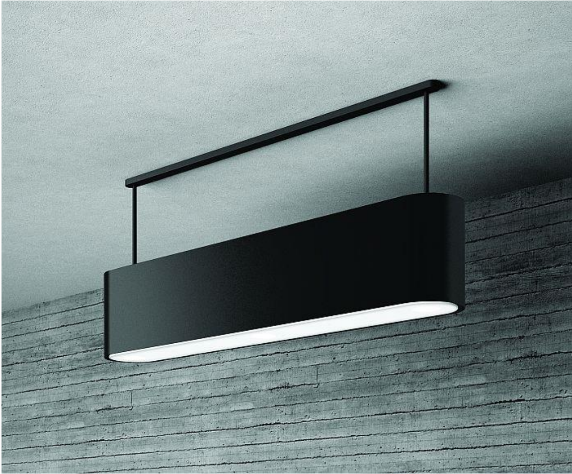
Campana 85 Fim.

Por último, se dio a conocer la empresa JP Industries , que cuenta con una gran planta de 200.000 m 2 , y que produce bajo el concepto de producto alemán fabricado en Italia. La marca de frío Seppelfricke es la que comercializará la empresa gallega en una primera fase, con nuevos frigoríficos free standing y built-in en gama alta.